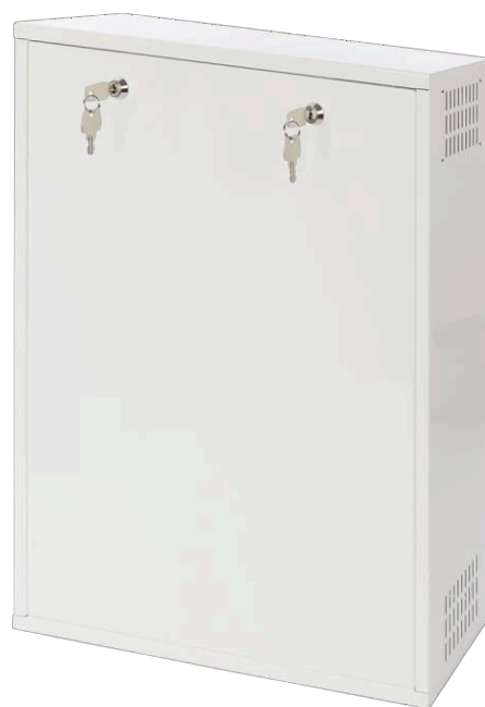
Abbildung 2. Ansicht des Gehäuses.