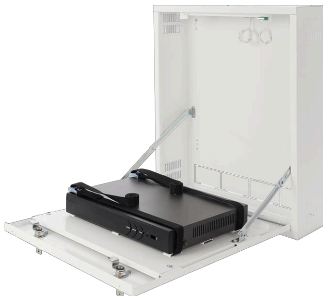
Figura 3. Montaje de la muestra - registrador

Pulsar sp. j. Siedlec 150, 32-744 Łapczyca, Polonia Tel. (+48) 14-610-19-45 Correo electrónico: sales@pulsar.pl http:// www.pulsar.pl