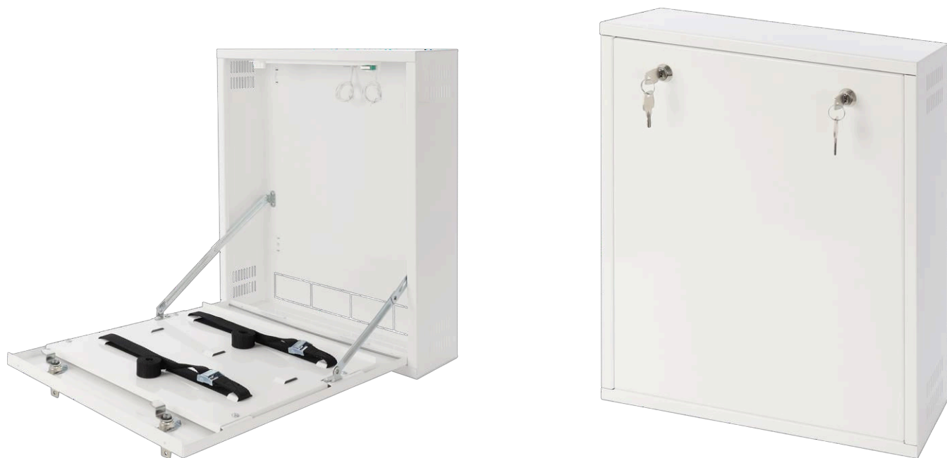
Figura 2. Vista de la caja.