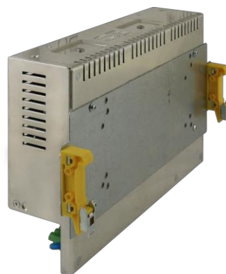
Fig. 1. Vista del soporte DIN4. Vista del soporte DIN4. Fig. 2. Ejemplo de montaje de la fuente de alimentación.