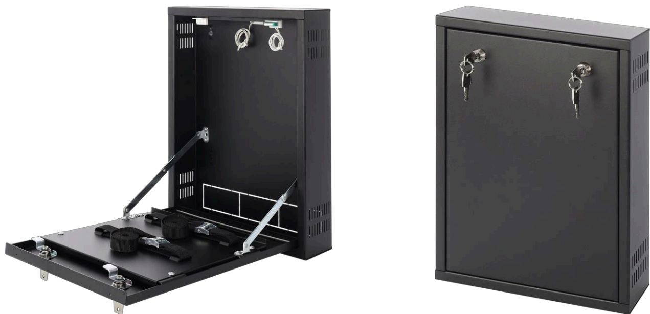
Figure 2. Vue de l'enceinte.