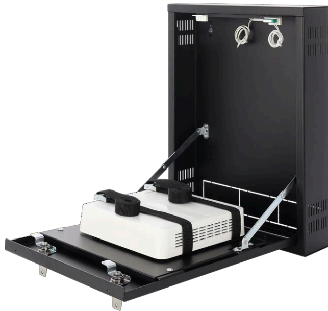
Figure 3. Exemple d'assemblage – enregistreur

Pulsar sp. j. Siedlec 150, 32-744 Łapczyca, Pologne Tél. (+48) 14-610-19-45 e-mail : sales@pulsar.pl http:// www.pulsar.pl