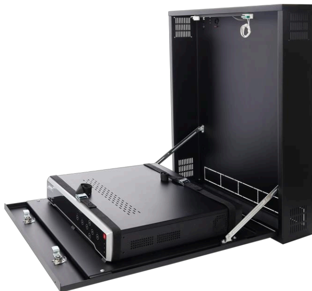
Figure 3. Exemple d'assemblage – enregistreur