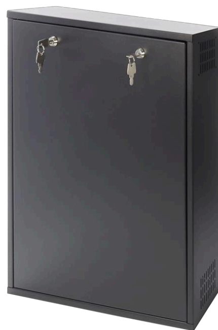
Figure 2. Vue de l'enceinte.