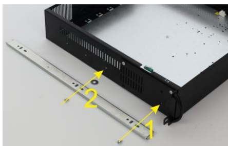
Fissare i cursori con due viti alla ARAD (non dimenticare la rondella distanziatrice sotto la seconda vite).