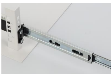
Rimuovere il cursore dalla guida ARAS

3.2. Rimuovere il cursore e fissarlo all'involucro ARAD (vite M4 + rondella). L'involucro deve essere fissato alla parte anteriore delle guide RACK con quattro viti M6.