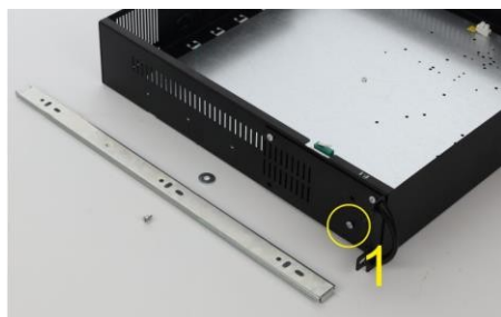
Rimuovere la prima vite M4 dall'involucro ARAD.