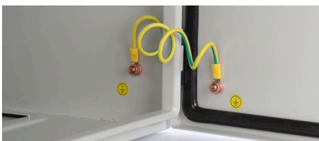
Filo di messa a terra - RAPU-Z