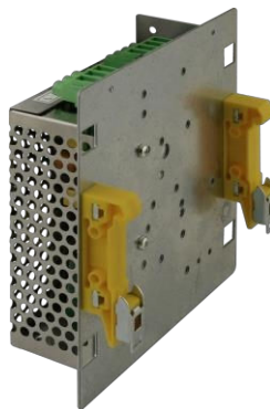
Fig. 2. Esempio di montaggio dell'alimentatore.