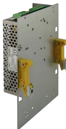
Fig. 2. Esempio di montaggio dell'alimentatore.