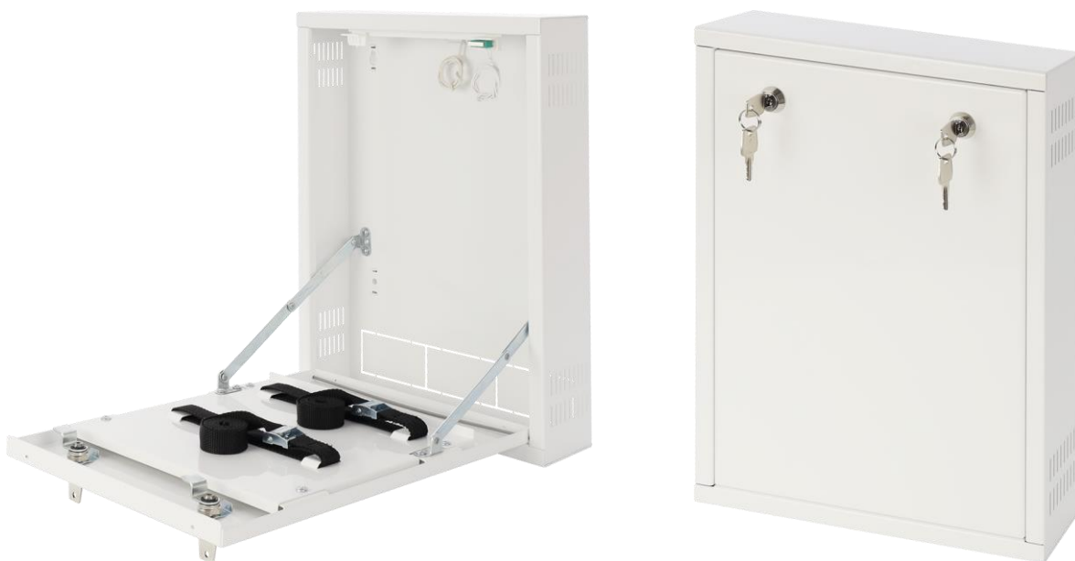
Rysunek 2. Widok obudowy