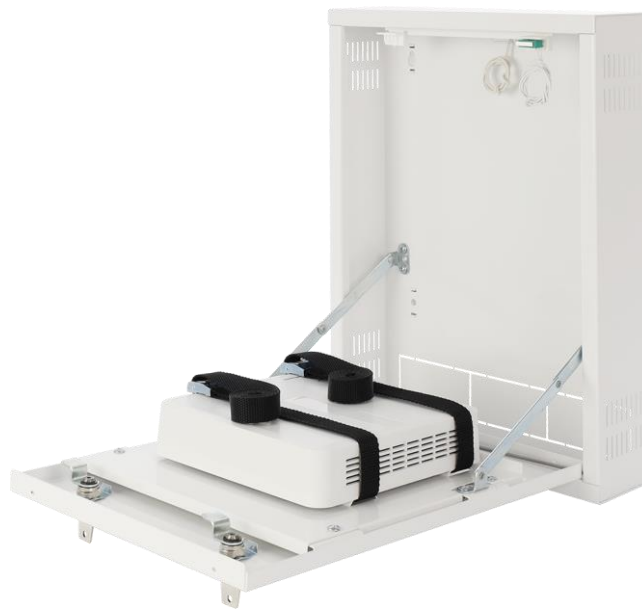
Rysunek 3. Przykładowy montaż – rejestrator