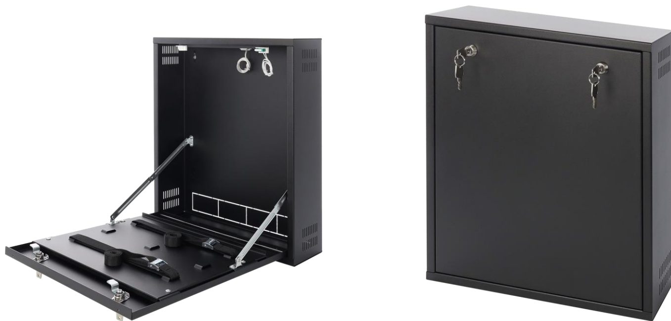
Rysunek 2. Widok obudowy.