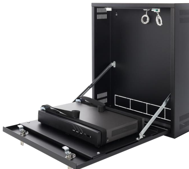
Rysunek 3. Przykładowy montaż – rejestrator