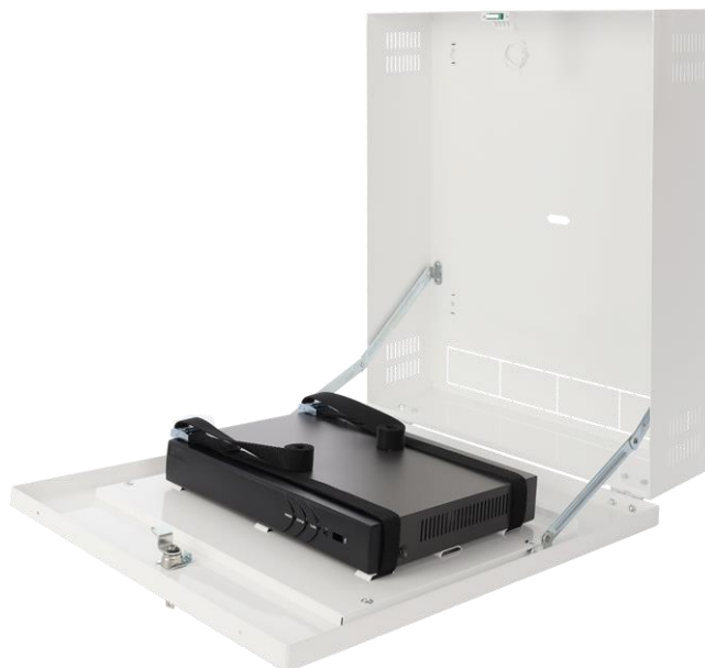
Rysunek 3. Przykładowy montaż – rejestrator