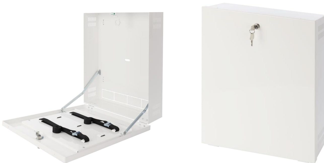
Rysunek 2. Widok obudowy