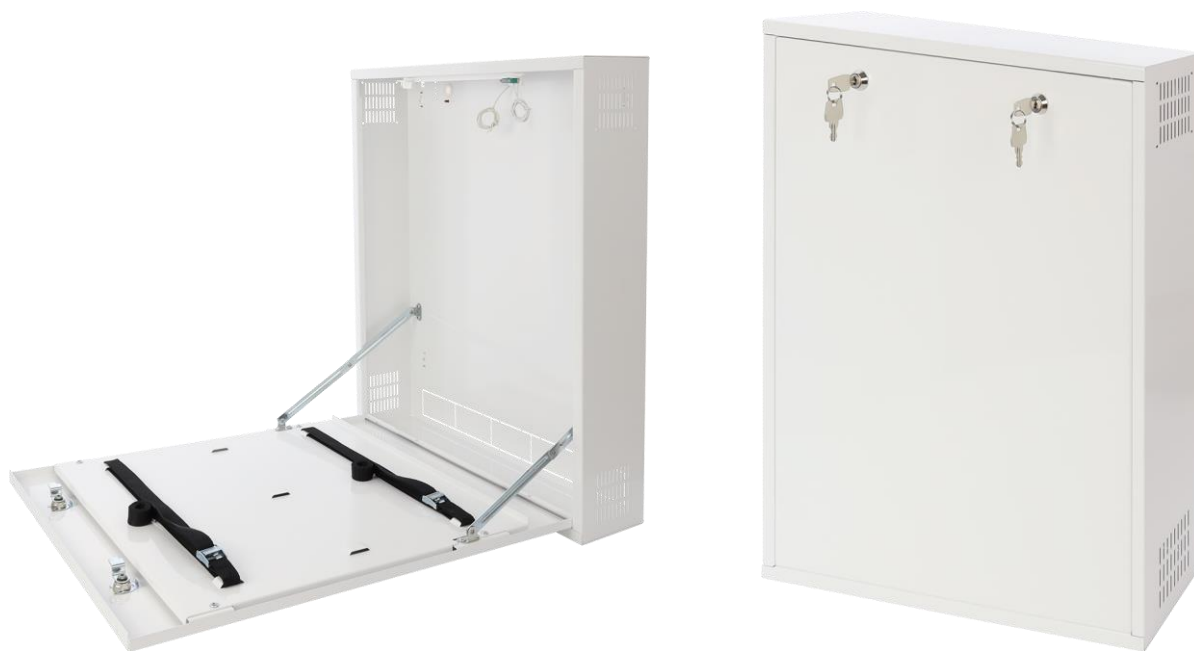
Rysunek 2. Widok obudowy