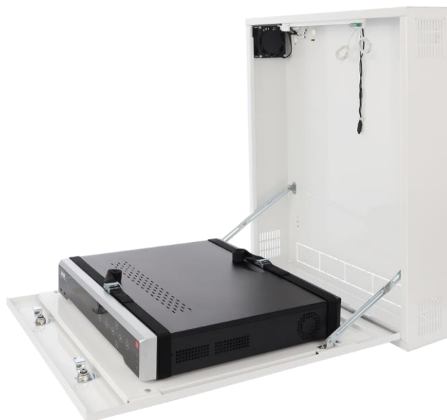
Rysunek 3. Przykładowy montaż – rejestrator