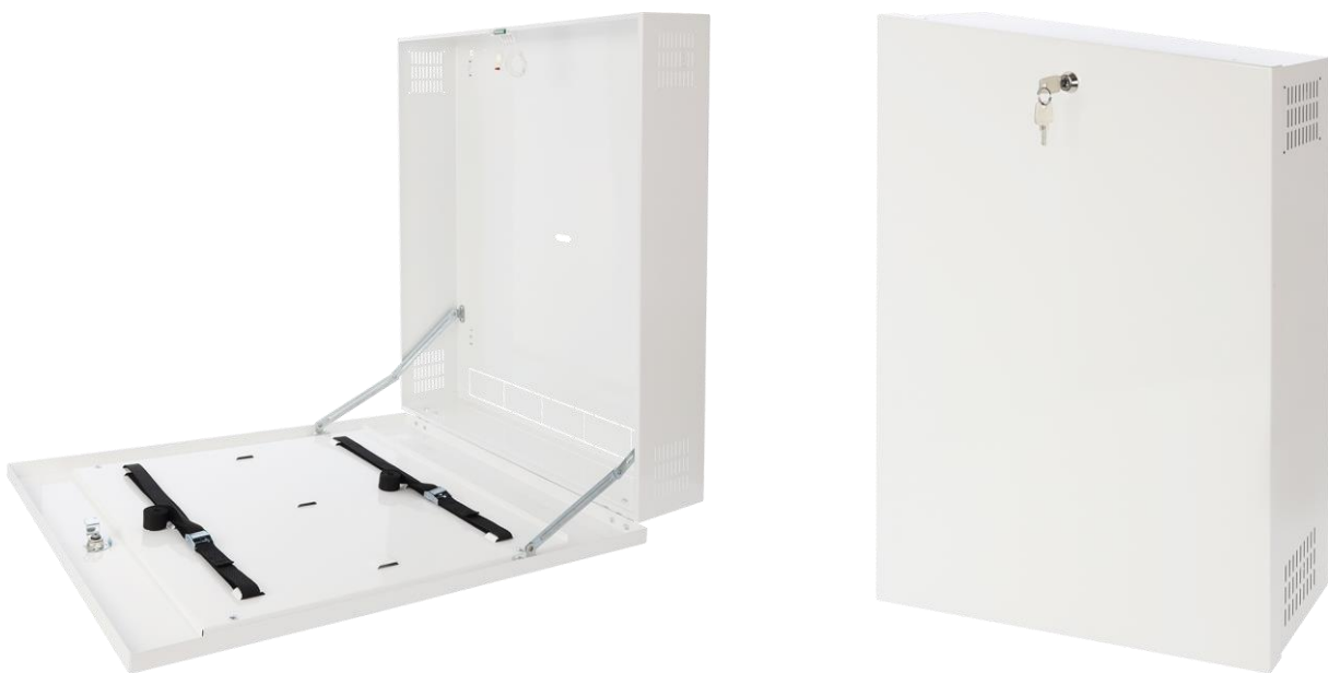
Rysunek 2. Widok obudowy