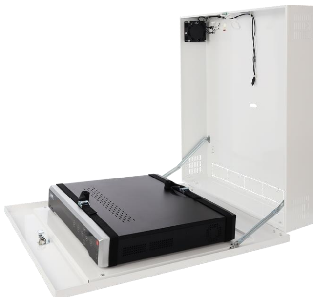
Rysunek 3. Przykładowy montaż – rejestrator