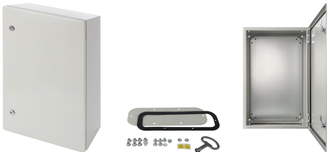
Rysunek 1. Widok obudowy.