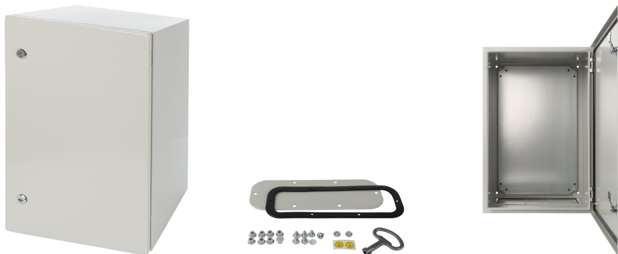
Rysunek 1. Widok obudowy.