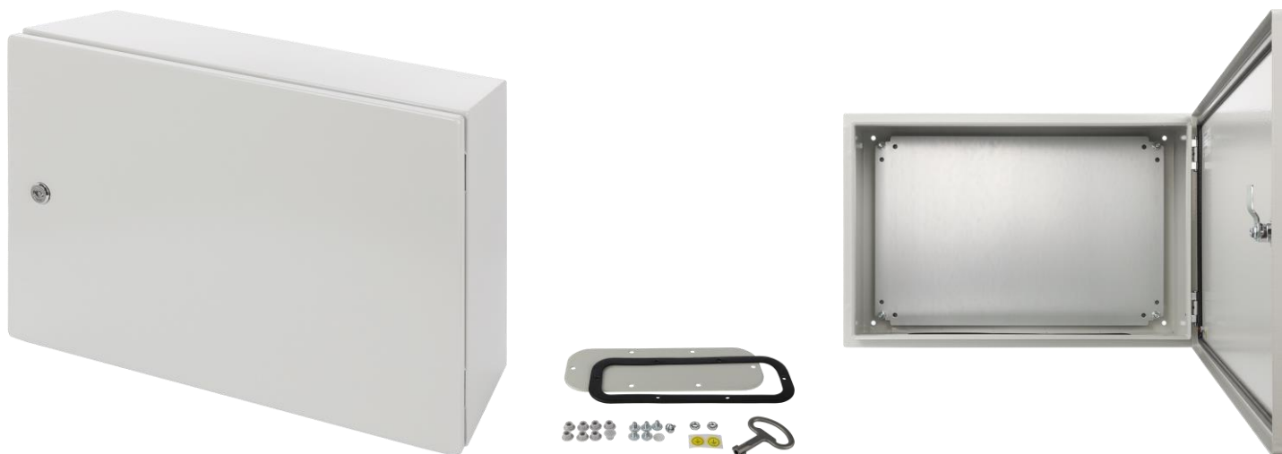
Rysunek 1. Widok obudowy.