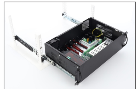
Montaż na szynie ARAS450N