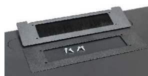
przepust szczotkowy RAPS-A