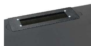
zamontowany przepust szczotkowy RAPS-A