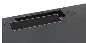
wybity przepust kablowy