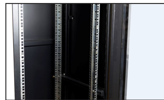
pusta szafa RACK 19"