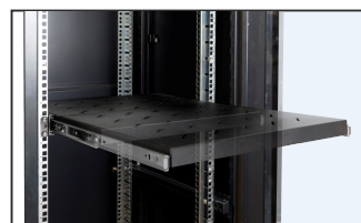
pełny wysuw półki