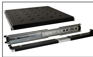
półka z prowadnicami