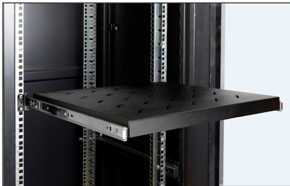
pełny wysuw półki