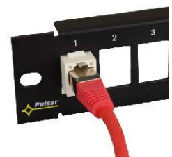
Keystone RJ45 konektor